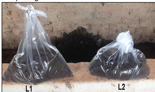
Figura 8. Amostras das leiras do sistema de compostagem.

Em relação aos parâmetros: carbono, pH, matéria orgânica, teor de umidade, nitrogênio e relação C/N, tiveram controle somente no início e no final do processo de compostagem, a qual foram coletadas amostras (Figura 8) e encaminhadas para o laboratório de Análises Químicas de Tecido Vegetal – UNOESTE.