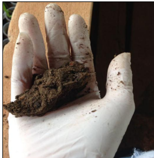
Figura 6. Monitoramento da umidade através do método empírico da bolota.

A umidade foi monitorada a campo semanalmente através do método empírico da bolota proposto por Kiehl (2002). O controle consistia em pegar uma pequena quantidade do composto na mão e apertar, se esfarelasse o composto era molhado com auxílio de uma mangueira, caso o composto estivesse pegajoso apresentava um bom estado e se estivesse gotejando, era necessário reduzir a umidade, deixando o composto secar naturalmente, além disso, também era necessário revolver toda a leira.