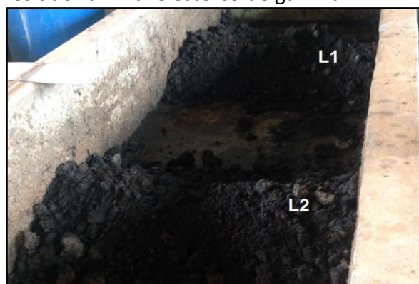
Figura 4. Leiras de compostagem, incluindo resíduo ruminal e esterco de galinha.

Os resíduos foram dispostos em camadas para montagem das leiras com auxílio de pás, como observado na Figura 4.