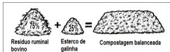
Figura 3. Composições de resíduos para o tratamento do resíduo ruminal.

duas leiras (L1 e L2) contendo composições de resíduos de ruminal e esterco de galinha (T= 75% RR + 25% EG). A massa total de cada leira foi de 150 Kg, sendo 112 Kg de resíduo ruminal e 38 Kg de material estruturante (Figura 3).