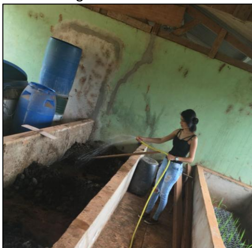
Figura 7. Umedecimento do composto com auxílio de mangueira.