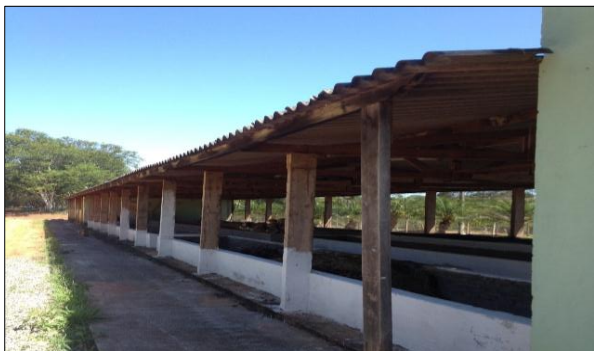
Figura 1. Vista geral da unidade de compostagem.