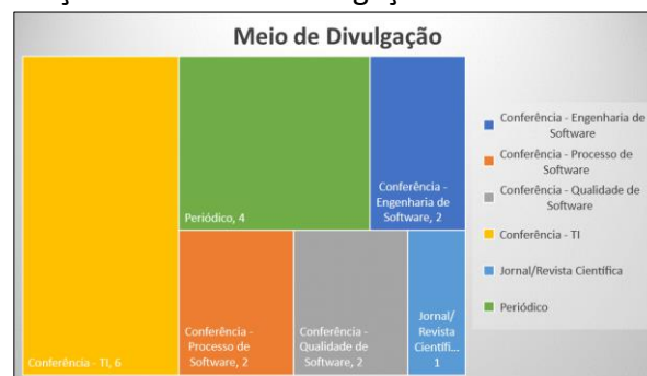
Figura 7. Distribuição dos trabalhos em função do meio de divulgação.

A consulta nas diferentes bases digitais retornou um total de 177 trabalhos científicos. A partir da aplicação dos critérios de exclusão, um total de 17 artigos foi selecionado para discussão no presente trabalho.