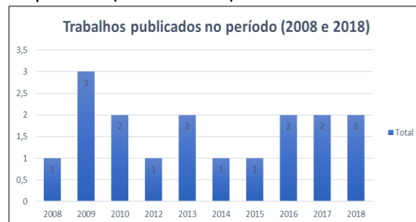
Figura 9. Quantidade de trabalhos publicados no período (2008 a 2018).

chamados trabalhos da literatura cinza. Garousi, Felderer e Hacaloğlu (2017; 2018) identificaram um total de 58 novos modelos de maturidade de teste e 117 modelos existentes, e confirmam os achados de Afzal et al. (2016), argumentando que o TMMi e seu antecessor, o TMM, e o TPI e seu sucessor, o TPI-Next, são os modelos de maturidade de teste mais populares. Garousi, Felderer e Hacaloğlu (2017; 2018) relatam que um total de 57 trabalhos apresentaram o TMMi e o TMM como modelo de avaliação ou modelo base para desenvolver o processo de avaliação, enquanto o TPI e o TPI-Next são encontrados em 18 trabalhos. Outros 28 trabalhos trazem outros modelos, tal como o SPICE e o TMap. Garousi, Felderer e Hacaloğlu (2017) argumentam, ainda, que os modelos e técnicas de maturidade em TMA/TPI atuais fornecem um suporte razoável para a indústria e para a comunidade científica da área.