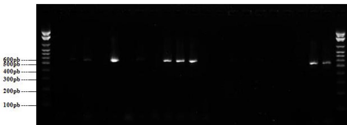
Figura 1. Eletroforese em Gel de Agarose para pesquisa do gene da mecA (533pb) pela técnica de PCR. L: Ladder 100pb; C-: Controle Negativo Cepa ATCC 25923; C+: Controle Positivo Cepa ATCC 33591; N: Controle da reação (H 2 O); Amostras Positivas: 7, 12, 13, 14 e 24.

Das 336 amostras mecA positivas 288 (85,70%) e 297 (88,40%) apresentaram fenótipo de resistência a oxacilina e cefoxitina, respectivamente, uma amostra (0,30%) apresentou fenótipo intermediário a oxacilina, 47